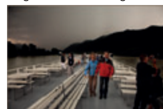
Weltuntergangsstimmung auf der Donau.