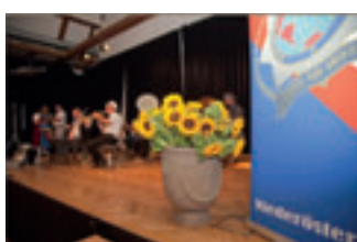
High Life in der Römerhalle.