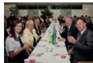
Die deutsche (hinten) und polnische Delegation (vorne).