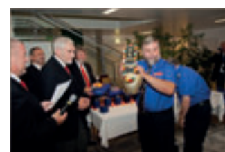
Uriges Schweizer Gastgeschenk.