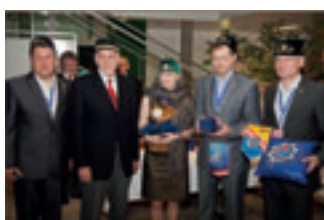
Unsere tartarischen Freunde.