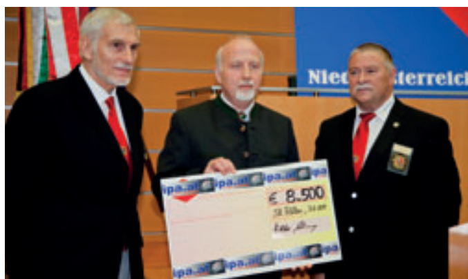
Die IPA Österreich mit ihren Landesgruppen und Verbindungsstellen spendet 8.500,-€ der Waldschule Wr. Neustadt und ermöglicht Schwerstbehinderten ein paar Tage Sommerfrische im Ausland.