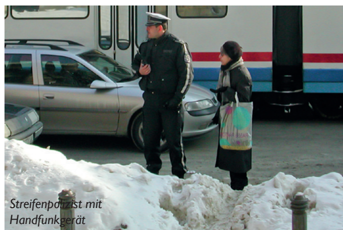
Streifenpolizist mit Handfunkgerät