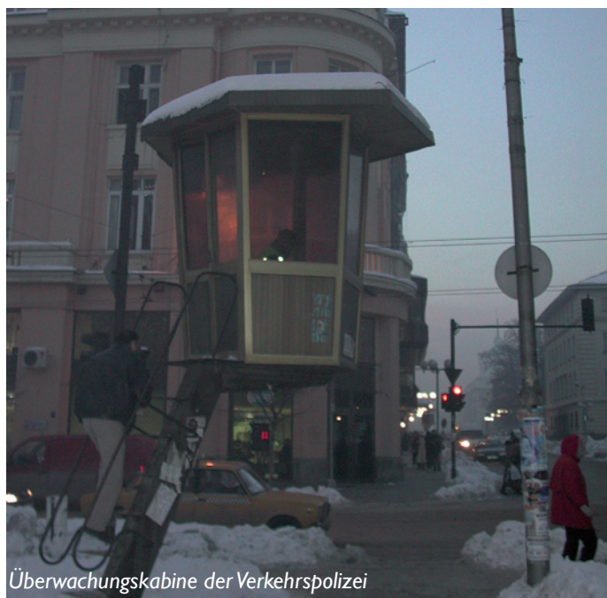
Überwachungskabine der Verkehrspolizei

gierung gewählt, aber Anfang 1997 kam eine parlamentarisch-demokratische Regierung an die Macht.