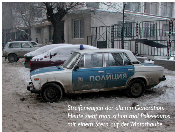
Streifenwagen der älteren Generation. Heute sieht man schon mal Polizeiautos mit einem Stern auf der Motorhaube.

Vor 1990 wurden polizeiliche Funktionen von der „Volksmiliz“ wahrgenommen. Diese Organisation umfasste folgendes: Die Territoriale Miliz, die örtlichen Strafverfolgungsbehörden, die Straßenmiliz, die Autobahnpolizei, aber auch die Staatspolizei, die Miliz, die Wirtschaftskriminalität, Betrug und Diebstahl untersuchte. Dann gab es noch die innere Sicherheitstruppe, die gemeinhin als die „Roten Barette“ bekannt waren. Sie waren eine militarisierte, leichte Infanterieeinheit, die für die Vermeidung von Unruhen und anderen Störungen der öffentlichen Ordnung verantwortlich war. Es waren ca. 15.000 Rote Ba-