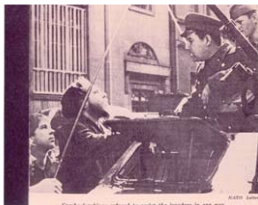
Bild 2: Passanten in Prag versuchen mit bloßen Händen gegen Panzer zu kämpfen

auch er ein „Kind des Kommunismus“ war, hatte er eine andere Vorstellung zur Umsetzung kommunistischer Ideologien. Dubcek strebte einen „Sozialismus mit menschlichem Antlitz“ an. Doch wie schon 12 Jahre zuvor in Ungarn, beendete die Sowjetarmee auch in der CSSR mit Hilfe der „Freunde des eigenen Militärbündnisses“ alle Bestrebungen nach Freiheit mit Waffengewalt. Panzer rollten durch die Städte, Soldaten scheuten vor keiner Gewalt