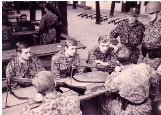
Bild 1: Soldaten des Bundesheeres unmittelbar vor dem Abmarsch zur Grenze