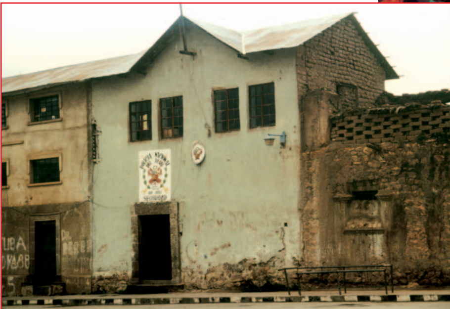
Triste Verhältnisse für Perus Polizei. Im Bild eine Polizeistation in der Vorstadt.

W elches sind die wichtigsten Herausforderungen im Rahmen der inneren Sicherheit in unserem Gebiet? Gemäß der durchgeführten Untersuchungen von der Comisión Andina de Juristas (CAJ) und des peruanischen Kriminalistikinstituts wurden bestimmte Indikatoren identifiziert, die diese offenen Fragen erhellen.