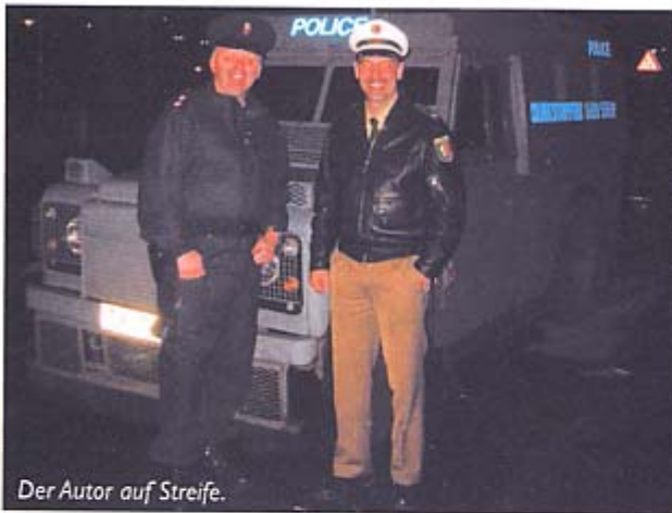
Der Autor auf Streife.