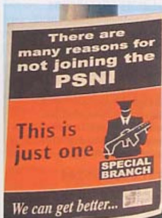
Propaganda gegen die Polizei.