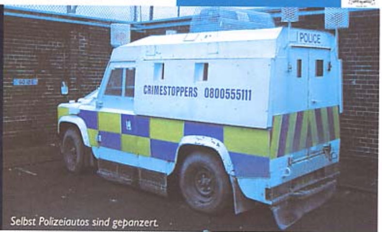
Selbst Polizeiautos sind gepanzert.

Wohngebieten der „working class“, führte in einer anderen Nacht zu einem Einsatz, als mit einem Benzinbrandsatz das Fahrzeug einer älteren Frau in Brand gesetzt wurde. Für meine nordirischen Kollegen Alltagsgeschäft. Nach deren Erfahrung kann die Begehung solcher Straftaten schon dadurch ausgelöst werden, weil eine Familie das Kind einer anderen Familie beschimpft hat.