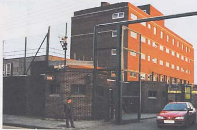
Jede Polizeistation ist eine Festung.

folgenden Tagen mit mir einige Ausflüge nach Antrim und Fermanagh machte und mir die wie Festungen ausgebauten Polizeistationen zeigte, konnte ich mir die schwierige Situation der Polizei vorstellen. Die von hohen Mauern umgebenen und mit Stacheldraht und Beobachtungstürmen versehenen Polizeistationen, deren Einfahrten mit automatischen Fahrzeugsperren und Stahltores gesichert waren, unterschieden sich extrem von allen Polizeigebäuden, die ich bisher in meinem Leben sah. Für Fremde war nur anhand des Polizeischildes und an den uniformierten, mit Schutzweste und MP5 ausgestatteten Kontrollposten erkennbar, dass es sich um eine Polizeistation handelt. Nachdem wir bei einem Ausflug irgendwo im unbewohnten ländlichen Nichts von Fermanagh auf einen vehicle check point (Fahrzeugkontrollpunkt) zufahren beschlich mich ein beklemmendes Gefühl, als mich Sergeant Mc Call auf die Kontrollstelle aufmerksam machte. Er forderte mich sogleich auf, meine Videokamera, mit der ich die seenreiche Landschaft filmte, auszuschalten und mich ruhig zu verhalten. Auf dem weiteren Weg zum Kontrollpunkt passierten wir zunächst einen im Straßenrand liegenden Soldaten, der uns mit seinem Maschinenge-