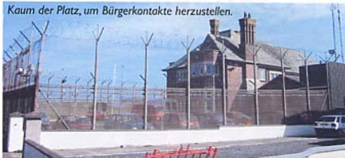
Kaum der Platz, um Bürgerkontakte herzustellen.

Abkommen gegen die militanten Proteste von Unionisten und Loyalisten zu verteidigen. Das hatte zur Folge, dass sich zahlreiche Polizeibeamte genötigt sahen, nun auch die protestantischen Arbeiterviertel zu verlassen, um sich in den Wohngebieten der Mittelschicht niederzulassen. Bangor und Moira, Städte mit einer überwiegend sozialen Mittelschicht, avancierten zu sogenannten „cop towns“.